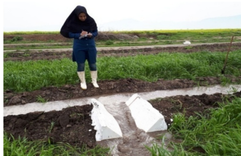
اندازه گیری میزان آب مصرفی با استفاده از پارشال فلوم

میزان آب مصرفی براساس حجم آب رهسازی شده از سد نگارستان و سطح اراضی آبیاری شده محاسبه شده است. همچنین حجم آب آبیاری در داخل مزرعه با استفاده از پارشال فلوم اندازه گیری شده است. لازم به توضیح است که با توجه به میزان بارندگی در منطقه تنها یک نوبت آبیاری غلات انجام میشود.